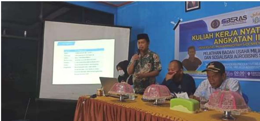
Gambar 3. Dokumentasi penyuluhan pemaparan manfaat aplikasi agribisnis store

Pada kegiatan pengabdian masyarakat ini, peserta BUMDES diberikan pemaparan materi tentang perkembangan teknologi sistem informasi e-commerce melalui aplikasi Agribisnis Store. Dalam pemaparan materi tersebut dijelaskan beberapa manfaat dalam melakukan pemasaran melalui aplikasi Agribisnis Store diantaranya, dengan memasarkan hasil produk di aplikasi Agribisnis Store dapat mempermudah komunikasi antara penjual dan pembeli, mempermudah pemasaran dan promosi barang serta memperluas jangkauan konsumen dengan pasar yang luas. Adapun dokumentasi kegiatan pengabdian kepada masyarakat tersebut dapat dilihat pada Gambar 3.