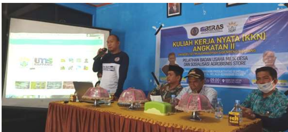
Gambar 2. Dokumentasi penyuluhan model pemasaran aplikasi agribisnis store

Pada kegiatan pengabdian kepada masyarakat ini didahului dengan memberikan materi secara rinci tentang model pemasaran aplikasi agribisnis store . Penyuluhan model pemasaran aplikasi Agribisnis Store ini dilaksanakan di balai Desa Timoreng Panua Kabupaten Sidenreng Rappang, Sulawesi Selatan. Tujuan dari penyuluhan tersebut untuk memberikan pengetahuan bagi peserta BUMDES terkait masalah fitur-fitur yang ada dalam aplikasi tersebut dimulai dari aktivitas transaksi jual-beli hasil produk, dan cara mengupload produk ke aplikasi. Adapun dokumentasi kegiatan ini dapat dilihat pada Gambar 2.