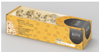
Gambar 4. Kemasan Mushroom Bite Tampak Samping

Tahapan berikutnya yaitu proses produksi cookies jamur tiram. Proses ini dilakukan di pabrik CV Assalam menggunakan alat penunjang serta bahan baku yang telah disiapkan sebelumnya. Alat yang digunakan dalam produksi cookies jamur tiram yaitu kompor, tabung gas, alat dapur, oven, mixer , baskom, dan timbangan digital. Proses produksi dilakukan sebanyak 5 hari dalam satu minggu dengan kapasitas produksi 15 boks dalam satu kali produksi, sehingga menghasilkan 300 boks dengan isi 10 cookies dalam satu bulan produksi. Proses produksi dilakukan oleh 2 orang karyawan produksi. Proses produksi ini dilakukan mulai dari pembuatan cookies hingga pengemasan. Kemasan untuk cookies jamur dapat dilihat pada Gambar 4.