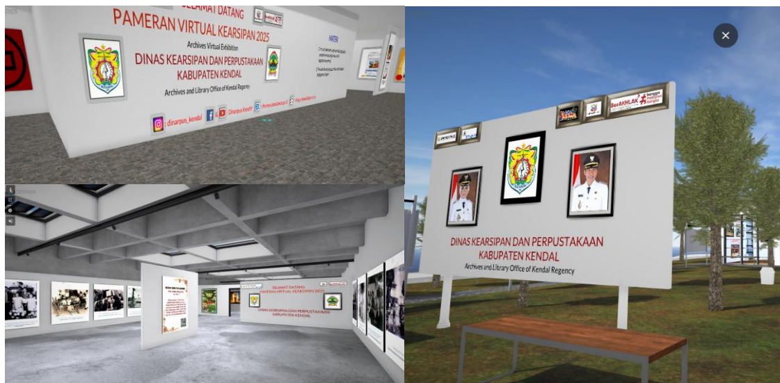
Gambar 2. Tampilan ruang pameran virtual kearsipan “Rumah Kendal” pada platform pameran digital.

Layanan arsip statis dalam pameran virtual “Rumah Kendal” dapat diakses secara daring oleh masyarakat melalui laman resmi Dinas Kearsipan dan Perpustakaan Kabupaten Kendal di https://dinarpus.kendalkab.go.id/pameran_kearsipan/2025 . Ketersediaan akses daring ini menunjukkan bentuk nyata dari penerapan prinsip layanan publik inklusif yang memanfaatkan teknologi digital untuk meningkatkan literasi arsip, memperkuat memori kolektif daerah, dan memperluas fungsi arsip sebagai sumber pengetahuan yang terbuka bagi masyarakat.