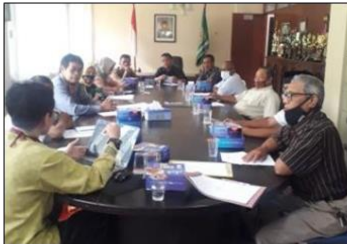
Gambar 2. Komunikasi Partisipatif

menunjukkan komunikasi partisipatif yang dilakukan tim pengabdian berdasar data observasi yang telah dilakukan.