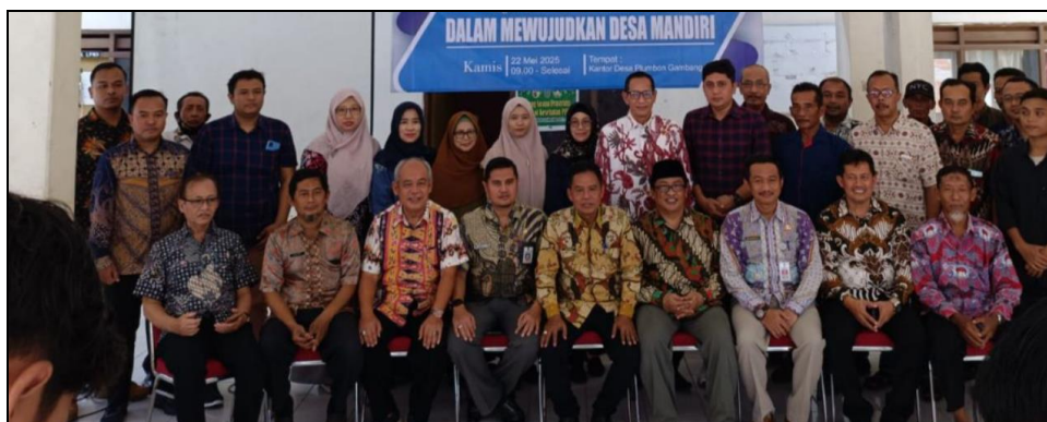
Gambar 3. Sosialisasi dan Edukasi