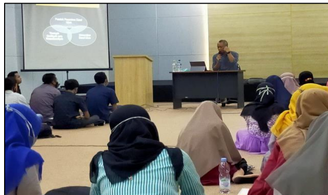
Gambar 4. Proses Edukasi lanjutan dan Evaluasi

Proses pendampingan tersebut masih dilanjutkan untuk masyarakat yang membutuhkan kelanjutan penanganan di tahun yang akan datang. Kegiatan ini bukan akhir dari perjalanan dalam proses pengelolaan system keuangan yang baik, namun sebuah awal dari proses penguraian system keuangan yang buruk menuju sistem keuangan yang baik dan benar. Peran Inklusi Keuangan Mempengaruhi Kehidupan Sehari-hari seperti;