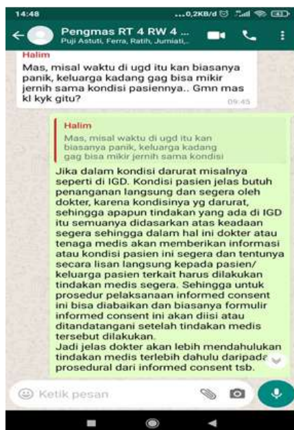
Gambar 2. Tanya jawab tentang prosedur pelaksanaan informed consent