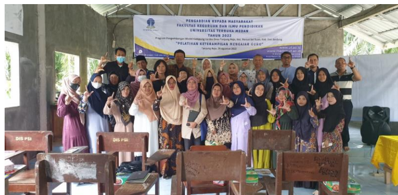
Gambar 2. Pelatihan Keterampilan Mengajar Guru