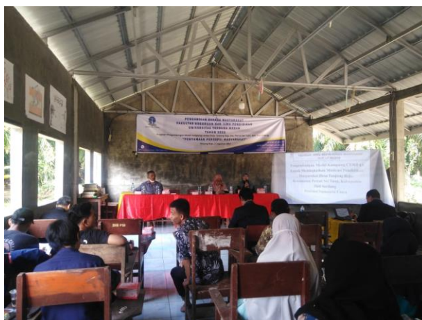
Gambar 1. Sosialisasi dan Penyamaan Persepsi