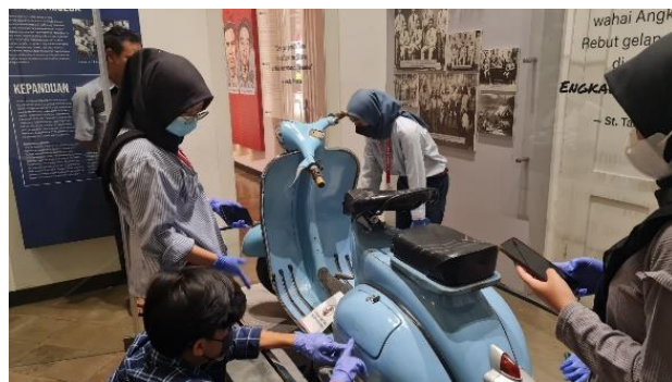
Pendataan Koleksi di Ruang Pamer Museum

Kegiatan pendataan koleksi dilakukan sesuai dengan prosedur yang telah ditetapkan. Dalam proses ini, penting untuk menggunakan sarung tangan dan masker serta