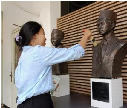
Gambar 2. Konservasi Koleksi Museum

Konservasi sendiri merupakan upaya yang dilakukan untuk memperbaiki kondisi fisik bahan pustaka dengan cara cara tertentu untuk memastikan keamanan dari faktor perusak (Rachman, 2017). Upaya konservasi yang dilakukan yaitu dengan membersihkan suatu objek koleksi di Museum seperti: Membersihkan hulu & bilah keris, rencong, pisau cukur, badik, dan tombak (senjata tradisional) dengan kain basah yang bersifat desinfektan, seperti alkohol atau etanol. Kemudian terdapat juga proses konservasi dan pembersihan pada koleksi-koleksi yang terbuat dari bahan logam, salah satunya adalah dengan polishing /menggosok logam dengan kain khusus untuk membuat logam kembali berkilau dan membersihkan residu dan debu yang menutupi logam tersebut dan memastikan penyimpanan yang baik. Selain itu, benda benda seperti patung di bersihkan dengan menggunakan kuas pembersih.