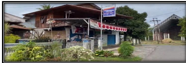
Gambar 2. Kondisi desa Wusa – Tempat Usaha

Pelaku UMKM di desa Wusa seringkali mengalami kesulitan kemudian berhenti di tengah jalan dan tidak melanjutkan usahanya. Beberapa alasannya yaitu minimnya modal usaha, pengetahuan bisnis yang terbatas, dan kurangnya inovasi produk dan pemasaran sehingga menyebabkan banyak dari mereka yang perlahan-lahan mulai meninggalkan usahanya dan kemudian berhenti untuk berusaha. Meskipun disadari oleh pelaku UMKM ini, bahwa usaha yang mereka jalankan telah banyak membantu perbaikan kondisi ekonomi baik keluarganya maupun desa Wusa secara umum.