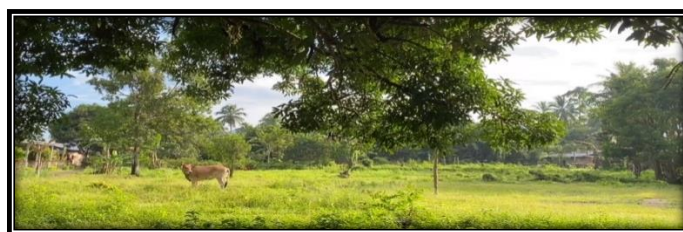
Gambar 1. Kondisi desa Wusa – Perkebunan

Desa Wusa merupakan desa yang terletak di kecamatan Talawaan, Kabupaten Minahasa Utara, Sulawesi Utara, dengan luas wilayah 1.027 ha. Lokasi desa ini berbatasan langsung dengan Bandar Udara Sam Ratulangi Manado tepatnya diujung sebelah utara landasan pacu, artinya ada banyak keuntungan yang bisa didapatkan oleh penduduk desa Wusa mulai dari penyerapan tenaga kerja hingga peluang usaha. Sebagian besar mata pencarian penduduk desa adalah sebagai petani kelapa, petani jagung, pengrajin batu bata, peternak, tukang bangunan, wiraswasta, PNS, pegawai swasta dan lainnya.