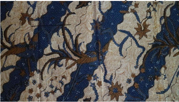
Gambar 3. Batik Motif Lerres kedua

Istilah Lerres sebenarnya merujuk pada penyebutan pola seperti garis lurus berjejer dari ujung kain ke ujung lainnya. Motif ini terdapat pada koleksi corak motif klasik Batik Pamekasan yang sampai saat ini masih diproduksi dan menjadi corak pakem. Berawal dari motif ini, kemudian menginspirasi diciptakannya berbagai motif dan