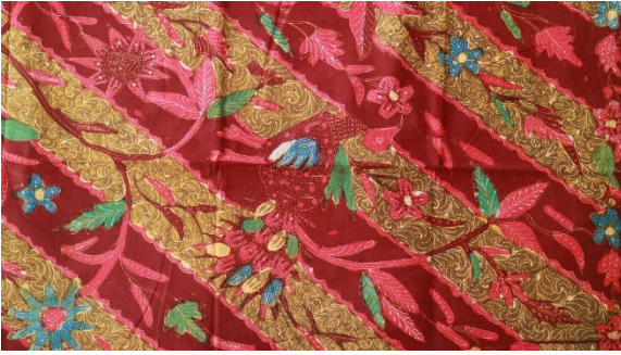
Gambar 2. Batik Motif Lerres pertama