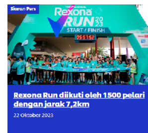
Gambar 4. Portal Website Unilever Indonesia. Tbk

brand Unilever, isu- isu sosial sesuai dengan komitmen Perusahaan sendiri yaitu tanggung jawab sosial korporasi dan keberlanjutan yaitu memperhitungkan dampak sosial dan lingkungan jangka Panjang. Seperti, Unilever di dalam webnya ada kolom planet & society yang menjadi inti tujuannya melindungi planet atau bumi ini dari kerusakan lingkungan, maka dari itu Unilever ingin meningkatkan Kesehatan bumi, contohnya atas gambar di bawah ini.