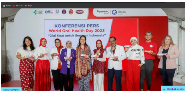
Gambar 5. Portal Website Unilever Indonesia Tbk.

Unilever sering kali merilis laporan keberlanjutan tahunan yang memaparkan pencapaian mereka dalam hal keberlanjutan dan tanggung jawab sosial korporasi. Laporan ini biasanya tersedia untuk diunduh di situs web dengan format pdf dalam bentuk buku yang menarik tentang laporan terbaru atas informasi keuangan juga kegiatan perseroan selama tahun berjalan yang berada di publikasi Perusahaan yang terbagi menjadi 3 laporan yaitu, laporan tahunan, laporan keuangan dan laporan sustainability report yang isinya tentang keberlanjutan dari perusahaan tersebut.