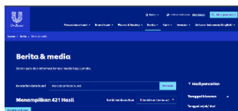
Gambar 2. Portal Website PT. Unilever Indonesia. Tbk

Informasi yang berkaitan dengan aktivitas media relations dari Unilever Indonesia di portal web resmi mereka mungkin berubah atas masa ke masa ataupun tahun ke tahun. Namun, di situs web perusahaan, biasanya dapat ditemukan berbagai jenis informasi serta kegiatan yang berkaitan dengan media relations .