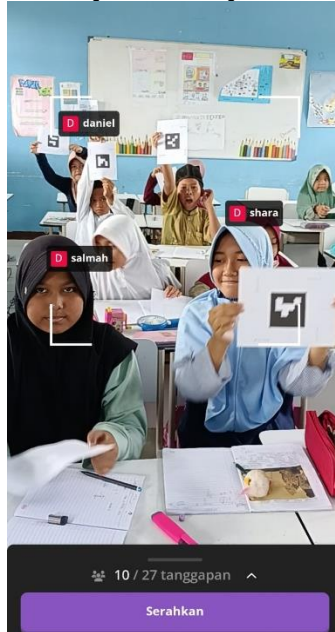
Gambar 4. Penggunaan Media Quizzizz

Pada pertemuan kedua, peneliti menyiapkan alat tes berupa permainan edukasi menggunakan proyektor, siswa diberikan lembar barcode untuk memilih jawaban dari soal pilihan ganda yang akan diujikan. Kemudian, peneliti melakukan tes dengan menggunakan aplikasi quizzizz untuk mengubah cara pengambilan hasil belajar. Adapun kegiatan ini, membutuhkan perangkat gawai dengan internet. Kendala yang dapat terjadi berupa hilangnya sinyal, namun selain kendala tersebut efek positifnya selama proses kegiatan ini, siswa memberikan respon positif. Hal tersebut terlihat pada kemampuan siswa membedakan jenis pecahan dari pecahan biasa, pecahan campuran dan pecahan desimal.