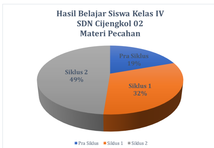
Gambar 9. Hasil Belajar Siswa

Secara keseluruhan siklus, didapatkan perkembangan hasil belajar siswa mengalami peningkatan pada materi pecahan. Meskipun hasil belajar siswa belum mencapai target yang diinginkan, hasil ini menunjukkan pengaruh positif pembelajaran berdiferensiasi terhadap fokus dan minat belajar siswa. Peningkatan hasil belajar secara keseluruhan dapat dilihat pada Gambar 9.