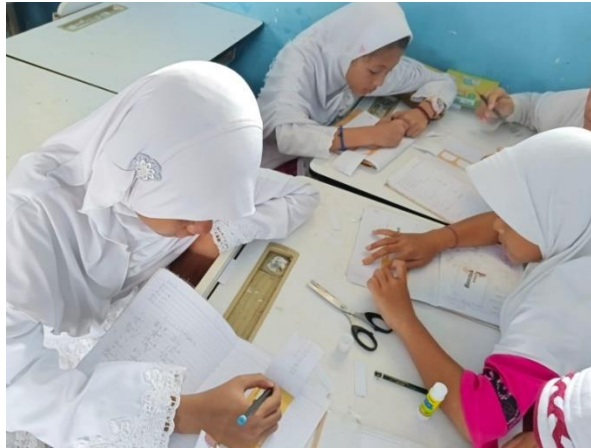
Gambar 2. Kegiatan Pembelajaran Siklus 1

mendampingi kelompok tersebut dalam memahami jenis – jenis pecahan. Hasil yang ditunjukkan cukup baik dengan mampunya siswa membedakan jenis – jenis pecahan secara lisan saat dilakukan tes verbal langsung selama proses pembelajaran. Siswa juga diberikan lembar tugas yang telah berisi berbagai jenis pecahan untuk diidentifikasi sesuai dengan jenisnya. Pembelajaran berdiferensiasi adalah pembelajaran yang memfasilitasi semua perbedaan yang dimiliki siswa secara terbuka dengan kebutuhan-kebutuhan yang akan dicapai oleh siswa (Fitriyah, 2023).