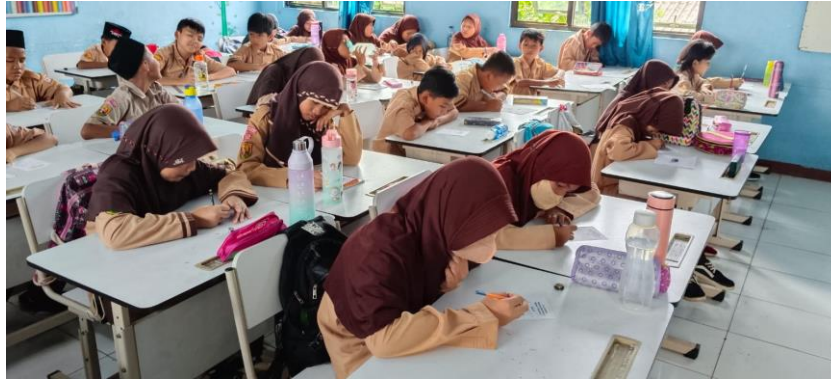
Gambar 6. Kegiatan Pembelajaran Siklus 2

Pada pertemuan kedua ini, peneliti meningkatkan tahapan materi mengenai cara penjumlahan dan pengurangan pada pecahan berpenyebut tidak sama. Dengan menggunakan cara berhitung kali silang untuk mencari pembilang dan mengalikan penyebut agar menjadi sama. Pada pertemuan ini peneliti mengumpulkan data hasil belajar melalui tes leveling, dimana telah disiapkan empat level pengetahuan materi pecahan dimulai dari pengenalan jenis pecahan sampai ke penjumlahan dan pengurangan pecahan yang akan dikerjakan oleh siswa secara bertahap dengan penilaian berdasarkan waktu pengerjaan.