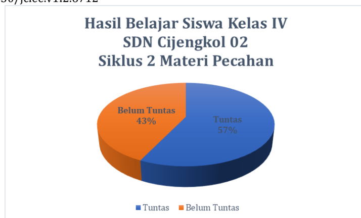
Gambar 8. Hasil Belajar Siswa Siklus 2

Secara keseluruhan siklus, didapatkan perkembangan hasil belajar siswa mengalami peningkatan pada materi pecahan. Meskipun hasil belajar siswa belum mencapai target yang diinginkan, hasil ini menunjukkan pengaruh positif pembelajaran berdiferensiasi terhadap fokus dan minat belajar siswa. Peningkatan hasil belajar secara keseluruhan dapat dilihat pada Gambar 9.