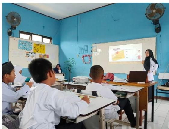
Gambar 3. Penggunaan power point sebagai media pada siklus 1

Setelah melaksanakan pertemuan pertama, peneliti melanjutkan tes hasil belajar di pertemuan kedua dengan rincian kegiatan sebagai berikut: (a) Penjelasan singkat materi pecahan senilai melalui power point interaktif (Diferensiasi konten), (b) Peserta didik dipersilahkan menyiapkan alat dan bahan berupa origami dan gunting untuk membuat pecahan senilai dalam bentuk bangun datar. (Diferensiasi konten) (Diferensiasi proses), (c) Penugasan peserta didik dilakukan dengan berdiskusi dengan kelompok kecil dan hasilnya dituliskan pada buku tugas individu. (Diferensiasi proses), (d) Peserta didik melakukan evaluasi hasil belajar menggunakan metode quizizz offline (Diferensiasi). Pada pertemuan kedua, peneliti menjelaskan kembali tentang pecahan senilai menggunakan media power point yang bisa disentuh oleh siswa agar siswa lebih memahami konsep pecahan dengan media interaktif, disamping itu peneliti juga menyiapkan alat praktek yang telah diinfokan kepada siswa untuk pembelajaran hari ini yaitu menggunakan potongan - potongan origami yang satu warna untuk menunjukkan nominal pecahan senilai. Siswa diberikan waktu untuk mengobservasi jenis-jenis pecahan dan pecahan senilai melalui 2 media tersebut. Kemudian siswa diberikan sebuah tes lisan dengan cara mempresentasikan origami pada lembar tugas yang sesuai dengan nominal pecahan senilai.