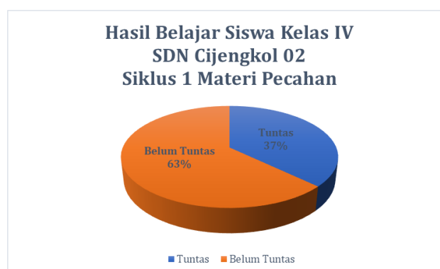
Gambar 5. Hasil Belajar Siswa Siklus 1

Berdasarkan penelitian yang telah dilaksanakan pada kegiatan siklus 1, sebanyak 13 siswa telah mampu memahami materi pecahan. Dengan dilaksanakannya pembelajaran berdiferensiasi secara proses dan konten dalam memahami materi, juga dibantu dengan berbagai media pembelajaran yang mendukung kegiatan. Hasil yang didapat masih belum mencapai harapan, karena masih ada sekitar 63 % siswa yang belum tuntas pada materi pecahan. Hasil belajar siswa siklus 1 dapat dilihat pada Gambar 5 .