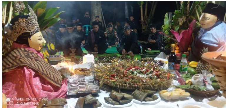
Gambar 1 Acara Tradisi Hajat Lembur di Kecamatan Cimenyan

Tradisi Hajat Lembur merupakan representasi yang bersifat kolektif dalam bentuk ritual-selebrasi, dengan ritus-ritus tertentu yang melekat dalam tradisinya. Dalam tradisi ini, selebrasi terjadi antara manusia (buana kecil atau mikro-kosmos) dan alam (jagat raya atau makro-kosmos), kemudian ada keselarasan progresif (homo-logis antropokosmis) di dalamnya ( CMS & Purnomowulan, 2016 ). Jika diartikan secara lebih luas, tradisi Hajat Lembur berkaitan dengan bumi dan memiliki makna vertikal dan horizontal terhadap Sang Pencipta dan sesama manusia. Hajat lembur itu sendiri mulai eksis sekitar tahun 1800-an, dengan esensi sebagai menjadi media untuk menjaga dan memelihara lembur, untuk memastikan bahwa manusia selalu dapat berkomunikasi dengan alam, sesama manusia, dan dirinya sendiri ( Wardiana et al., 2018 ). Di beberapa daerah, tradisi Hajat Lembur ini dimaknai sebagai tradisi yang bersifat kondisional, meninjau dari segi pelaksanaannya yang dapat menyesuaikan dengan kondisi kehidupan pada saat itu ( Wardiana et al., 2018 ). Hajat Lembur dapat dilaksanakan ketika: (1) perayaan 1 Muharam bersamaan dengan selesainya masa panen besar, (2) tolak bala, (3) masa tigerat (paceklik) atau saat terjadi musibah, atau (4) berdasarkan firasat atau kila-kila sesepuh yang dituakan sebab sesepuh dipercayai memiliki kemampuan dalam konsep melihat masa depan. Namun demikian, esensi dalam tradisi Hajat Lembur ini tidak lepas dari nilai spiritualitas dan religius masyarakat di tatar Sunda.