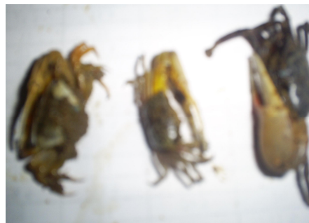
Gambar 3. Jenis Kepiting.

Jenis-jenis kepiting yang ditangkap pada perairan hutan mangrove sebanyak 3 (tiga) jenis, terdiri dari : Scilla ocellata sebanyak 14 ekor, Portunus sanguinolentus sebanyak 40 ekor dan Mucir longicarpus sebanyak 60 ekor. Tiga jenis sampel tersebut merupakan data primer dan kemudian diidentifikasi berdasarkan jenis atau spesiesnya. Pengambilan sampel dilakukan dengan menggunakan metode kuadran (pasang tertinggi-surut terendah) dengan jarak 20 meter kearah laut. Jenis-jenis kepiting dapat dilihat pada Gambar 3.