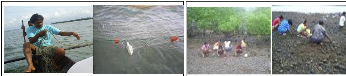
(1). Aktivitas penangkapan ikan